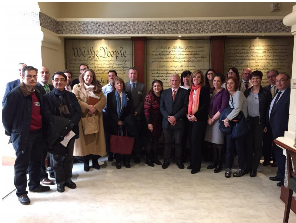
SWIIS members at the US Embassy in Madrid