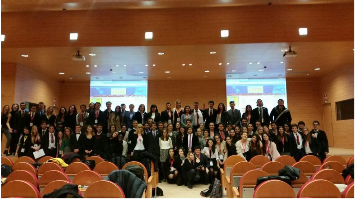
UN Model, Faculty of Political Sciences and Sociology, Madrid