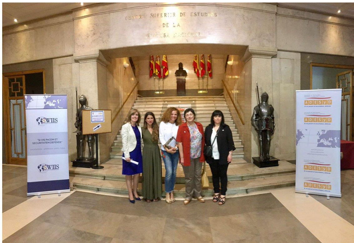
Presentation of the Book "Sharing Views on Security", CESEDEN, 7 June 2017