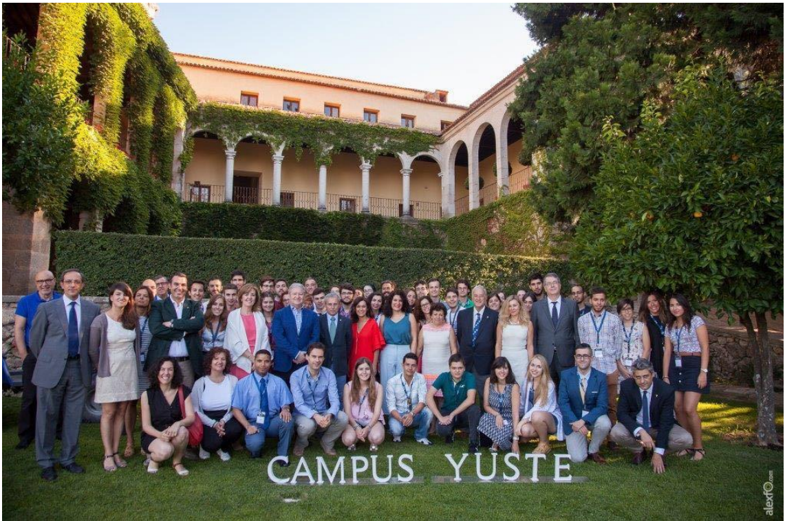
Participation in the Summer Course organized by Campus Yuste on “The dream of the European Security and Defence”