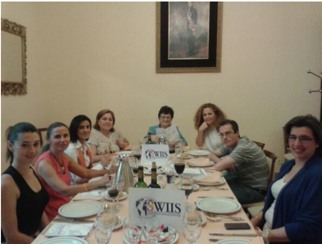
SWIIS Working Lunch