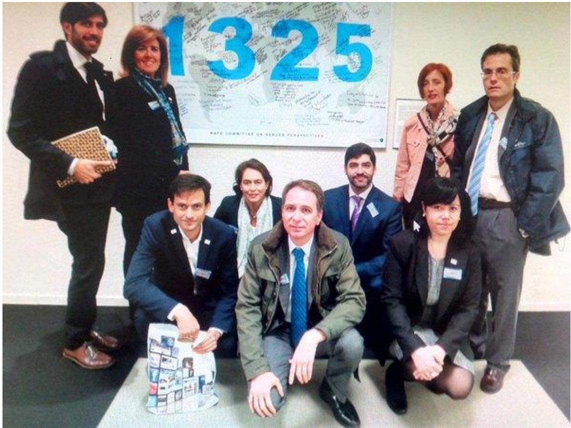
SWIIS members visit NATO's Headquarter in Brussels.