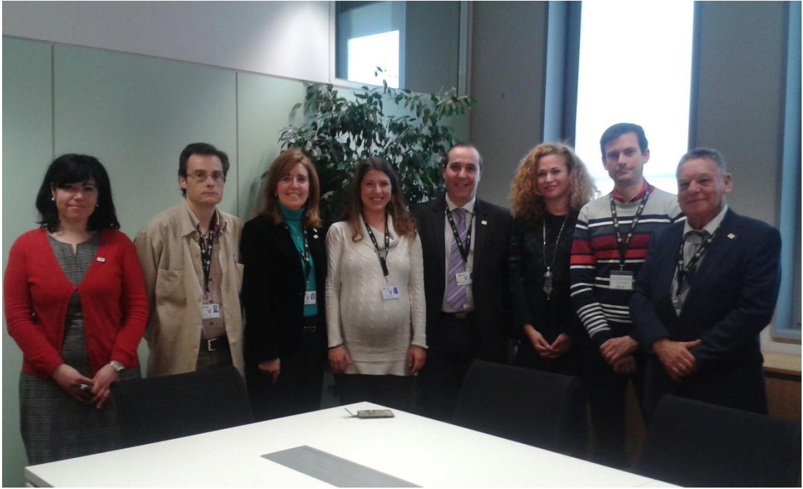
SWIIS-ADESyD- Steering Board.