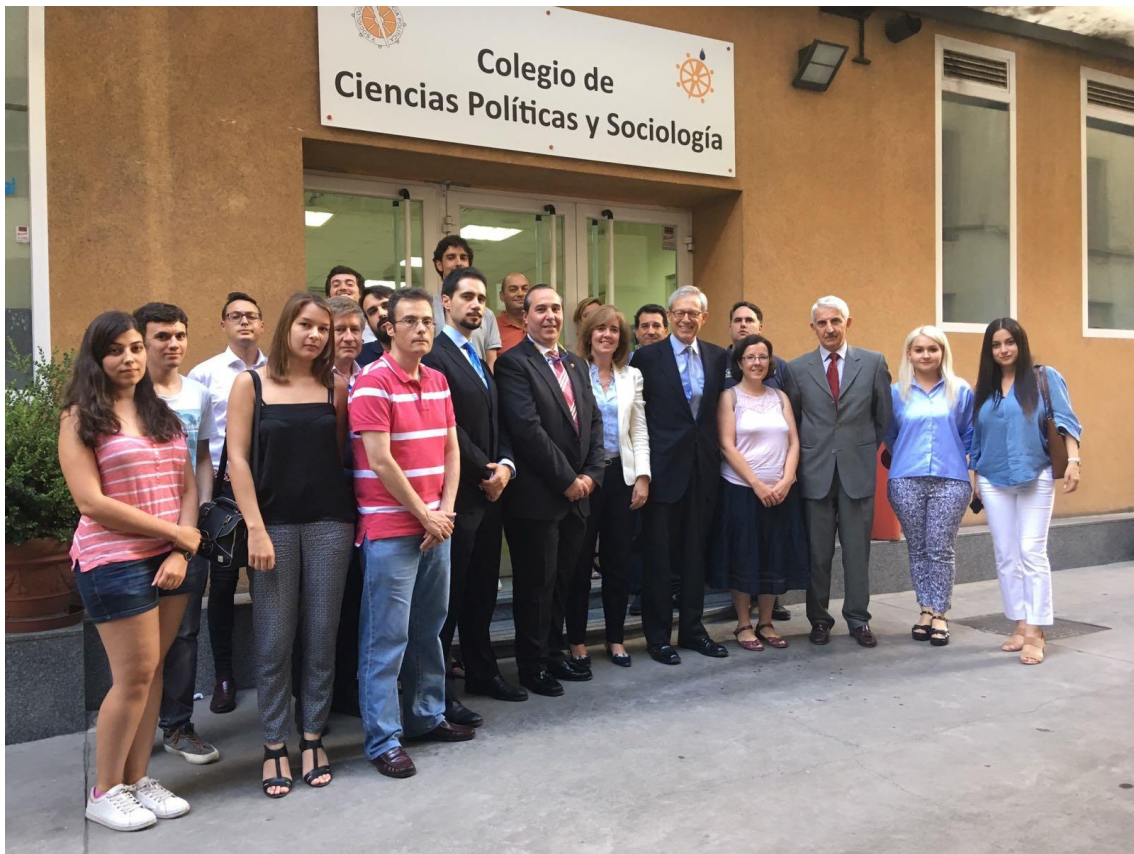
ADESyD SWIIS Students at the 6 th Summer Course, July 2017