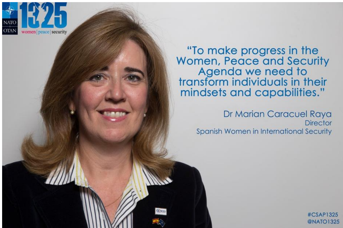
NATO's Civil Society Advisory Panel (#CSAP1325)