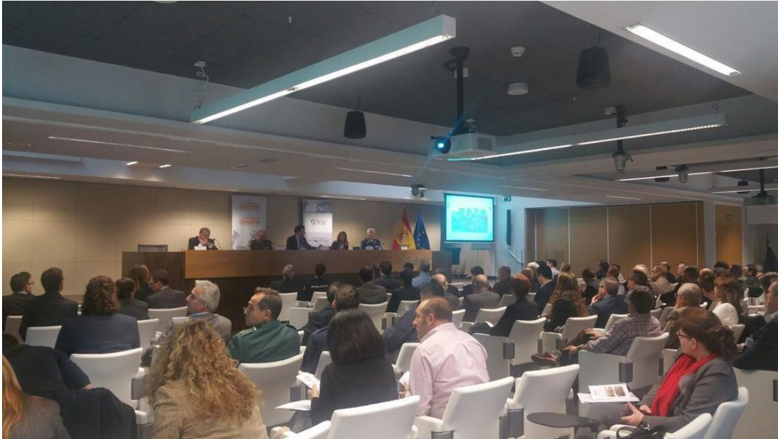
ADESyD's 3 rd Congress "Sharing Views on Security", November 2016