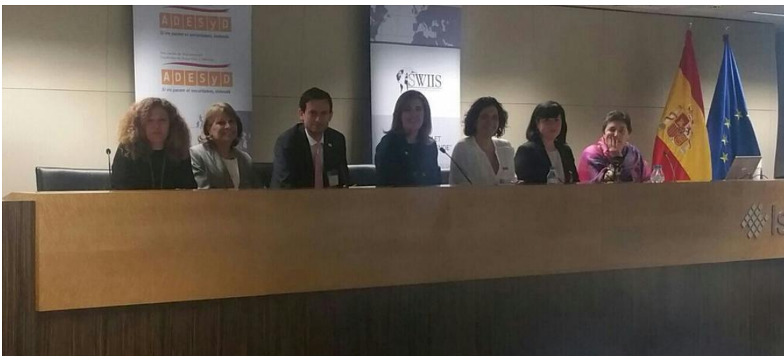
SWIIS members at ADESyD's 3 rd Congress