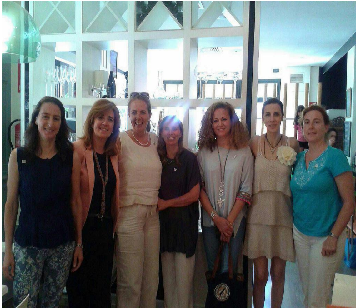
SWIIS members working lunch to share experiences on Security from a comprehensive point of view (civilian, military, police, cooperation...etc)